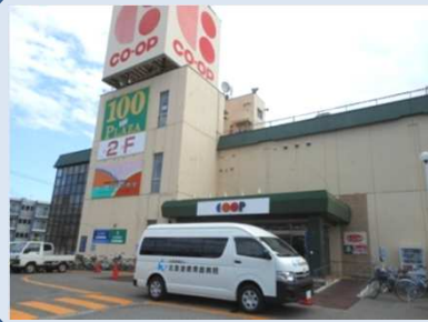
コープさっぽろ西岡店前